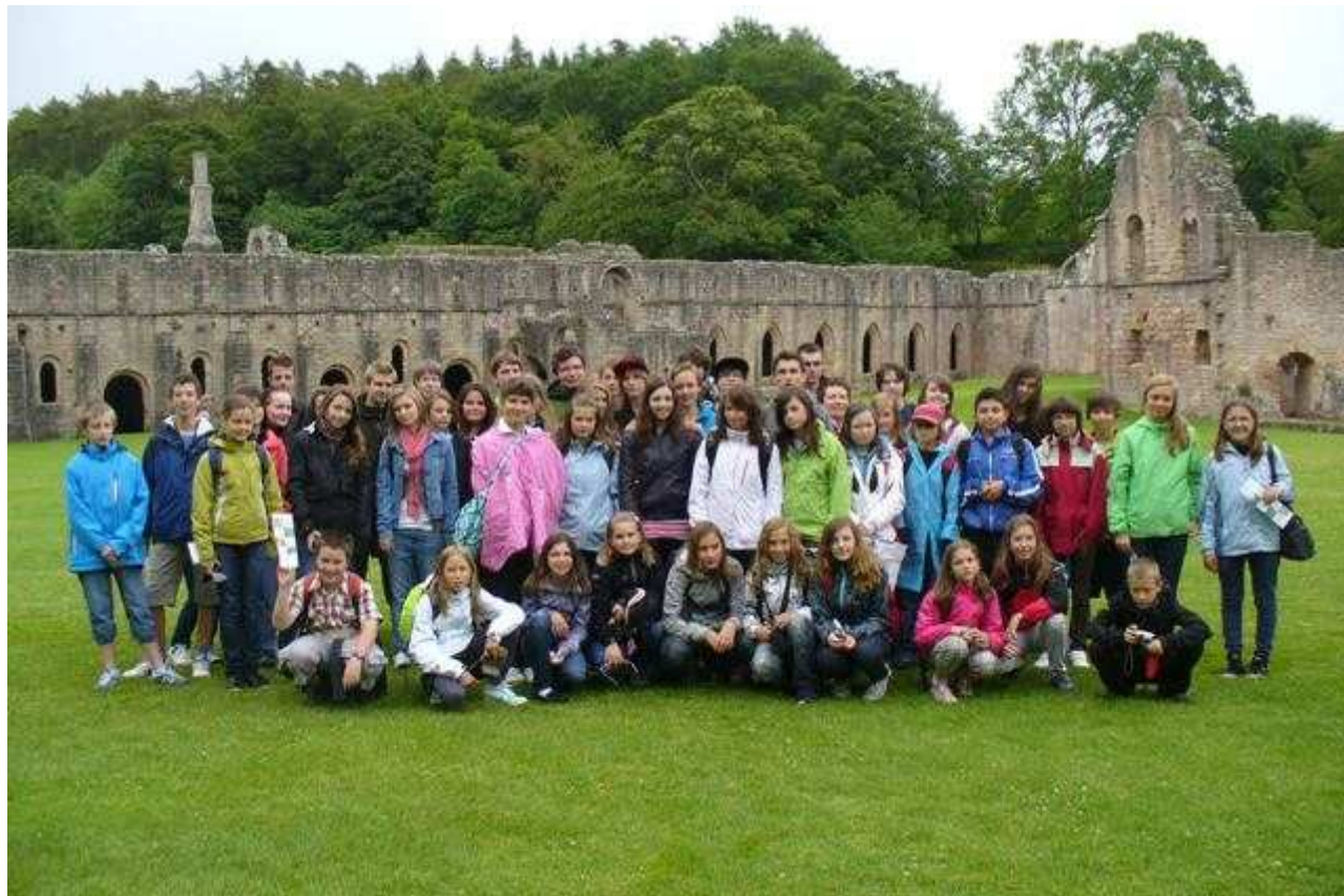
Jazykový kurz ve Velké Británii – snímek z výletu do Fountains Abbey.

Náš tým tvořily dvě paní učitelky a jeden pan učitel, jedna úžasná průvodkyně a dva skvělí řidiči. Celý pobyt se nám všem moc líbil a myslím si, že si ho někteří z nás za dva roky zase rádi zopakují.“