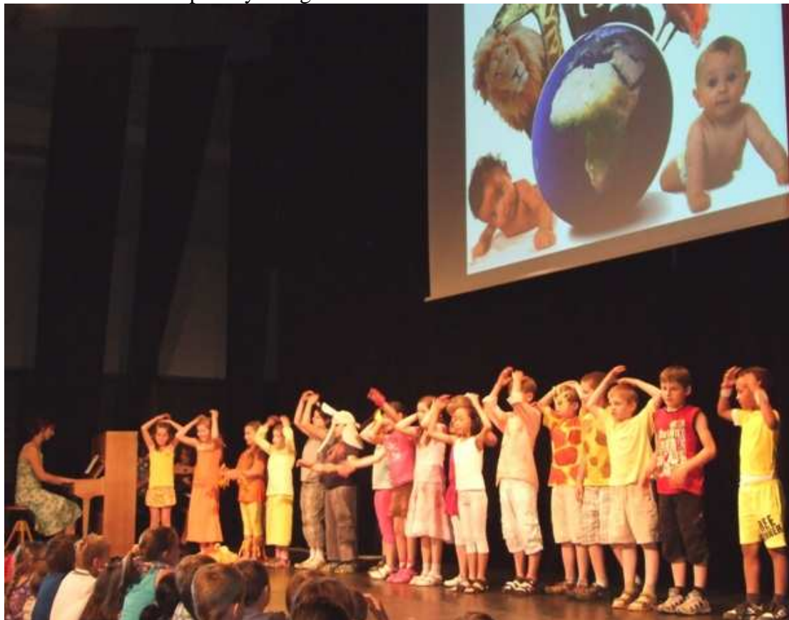
Ze školní akademie v kulturním domě Mlejn

vystoupení. Naši nejmladší žáci tančili mazurku, street dance, předváděli moderní gymnastiku, recitovali a zpívali česky, anglicky, francouzsky i německy. Diváci zhlédli krátké scénky, kde se děti mohly pochlubit, jak již umí anglicky. Na své si přišli i milovníci houslí, píána či akordeonu. Žáci přidali několik čísel stepu, španělských, německých, francouzských a anglických písní. Kromě stepu jsme mohli vidět rock 'n roll, aerobik či irský tanec nebo parodii na Sněhurku a trpaslíky v angličtině.