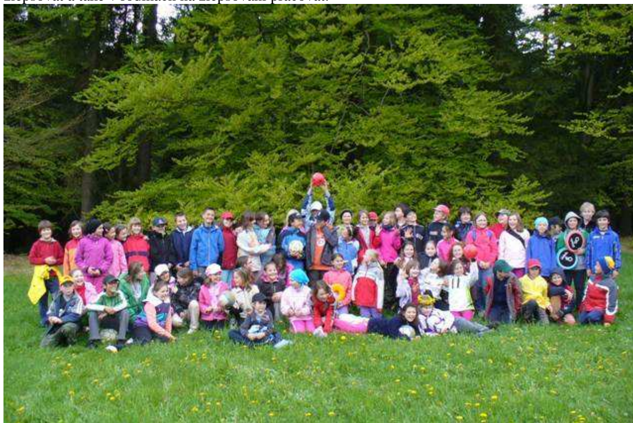
Účastníci jubilejní 10. školy v přírodě s angličtinou.

Závěrečné zhodnocení: Škola v přírodě si kladla za cíl pomoci dětem v rozvoji samostatnosti, zlepšení vztahů a komunikace mezi žáky a mezi žáky a učiteli, pomoci odbourat ostych při mluvení anglicky, poznat zajímavosti kraje Železných hor, najít zálibení ve společných hrách a zábavě. Ne vše se nám za krátký pobyt podařilo zlepšit. Určitě si mnohé děti dokázaly poradit s novými situacemi, kterými bylo například odloučení od své rodiny, společný pobyt na jednom pokoji se spolužáky, sledování a dodržování společných domluv a pokynů, apod. Pobyt ve škole v přírodě nám ukázal, v čem se musí děti ještě zlepšovat a také v rodinách na zlepšování pracovat.