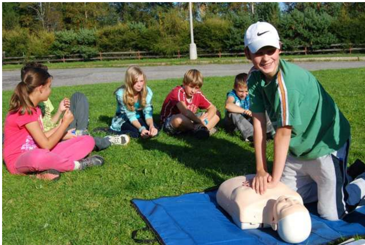
Účastníci adaptačního kurzu 6. tříd při nácviu první pomoci.

v budoucnu pomoci například při řešení a pochopení nastalých situací. Přece jen každý žák je originál a lidská psychologie je složitá. V neposlední řadě je ale popisovaná aktivita zdrojem zážitků, nových poznání, ale i zábavou a relaxací. Tentokrát jsme se vydali se 6. třídami do Nových Hutí na Šumavě.