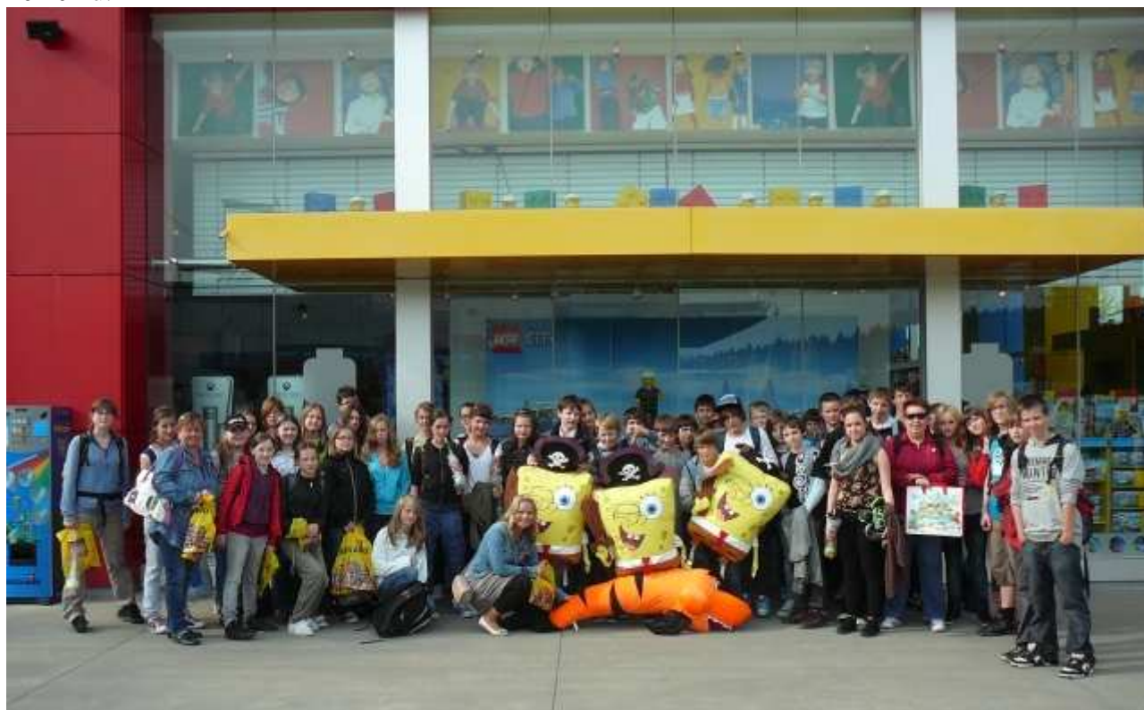
Účastníci zájezdu do bavorského Legolandu Deutschland

„Ve čtvrtek 28. dubna se žáci 6. a 7. ročníku zúčastnili celodenního výletu do jednoho ze dvou německých LEGOLANDŮ. Autobus s 3 pedagogy a 45 žáky vyjel od naší školy v brzkých ranních hodinách. Po hladkém průběhu cesty jsme krátce po desáté hodině dosáhli cíle, stanuli jsme před branami LEGOLANDU DEUTSCHLAND, jak zní oficiální název zábavního parku, který je rozlohou veliký jako 26 fotbalových hřišť. Když jsme se vstupenkami a mapami areálu prošli branami parku, bylo před námi krásných 6 hodin plných nevšedních staveb, zmenšenin známých evropských měst, neobvyklých atrakcí – to vše z lega. Byly zde také dobrodružné tematické atrakce, které ke každému zábavnímu parku zajisté patří. Na své si přišli i obdivovatelé a příznivci hraček z lega, které zde byly hojně nejen k vidění, ale i ke koupi. Toho mnozí využili, aby měli památku na další úžasný výlet organizovaný naší školou. Co říci závěrem? Netrpělivě očekávaný výlet do LEGOLANDU se vydařil se vším všudy, i počasí nám přálo a samozřejmě jsme si bezvadně procvičili němčinu.“