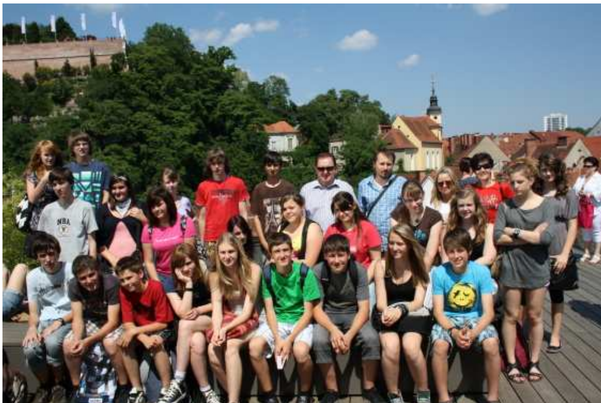
Účastníci mezinárodní spolupráce na vyhlídkové plošině v Grazu